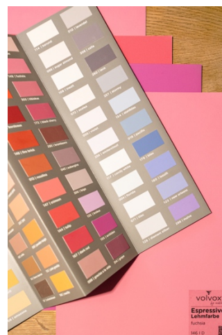
Die Farbtrends 2023