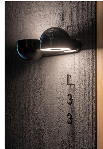
An den Flurwänden im Farbton Anthrazit 158 verbinden sich Haptik und Sinnlichkeit.