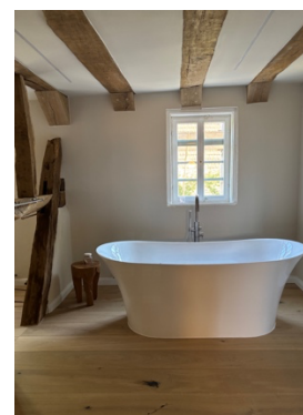
Entspannt durchatmen im Bad: Mit den Lehmfarben von Volvox